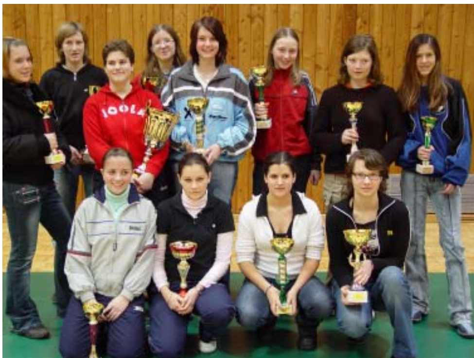
Die Nachwuchs-Superliga macht offensichtlich Spass - Strahlende Mädchen in Kapfenberg