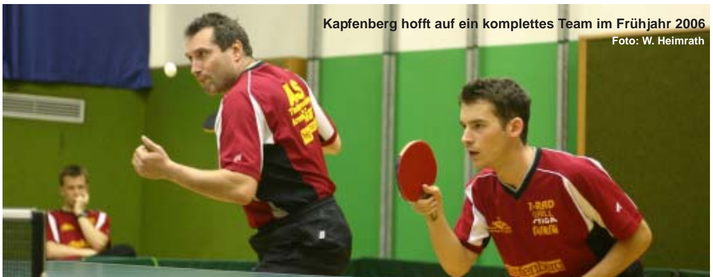
Kapfenberg hofft auf ein komplettes Team im Frühjahr 2006

Wolfgang Heimrath Sportwart des St.T.T.V.